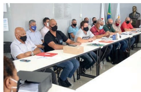
Reunião de Negociações Coletivas