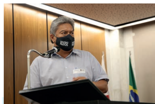
Audiência Pública que discutiu o transporte em Minas Gerais