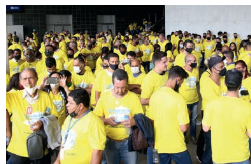
Mobilização na ALMG contra o transporte clandestino

O 1º de maio é um dia para lembrarmos que não estamos só, pois junto conosco, nesse dia, milhões e milhões de trabalhadores em todo o mundo estão unidos sob a mesma bandeira.